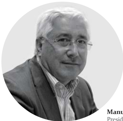
Manuel de Lemos Presidente da UMP