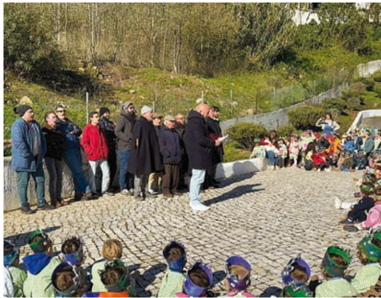
O encontro das crianças do centro infantil com o grupo de reiseiros da Ota aconteceu na manhã do dia 6 de janeiro

A Misericórdia de Alpalhão apoia cerca de 120 pessoas.