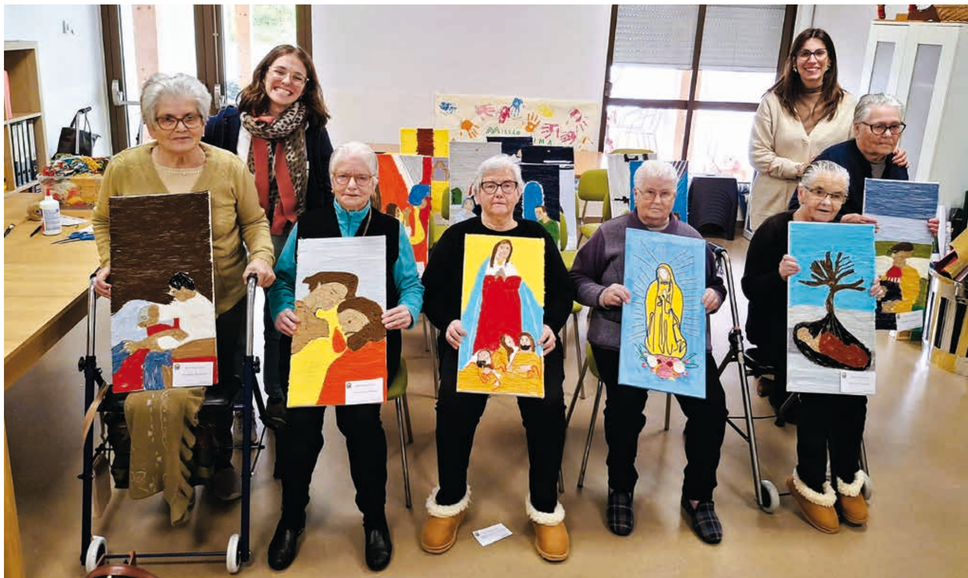
Projeto nasceu de uma parceria entre a Santa Casa, o CACI de Mora e a Cercimor de Montemor-o-Novo

Em Mora, a arte abstrata tornou-se linguagem para revisitar as 14 obras de misericórdia, cruzando inclusão, memória e comunidade