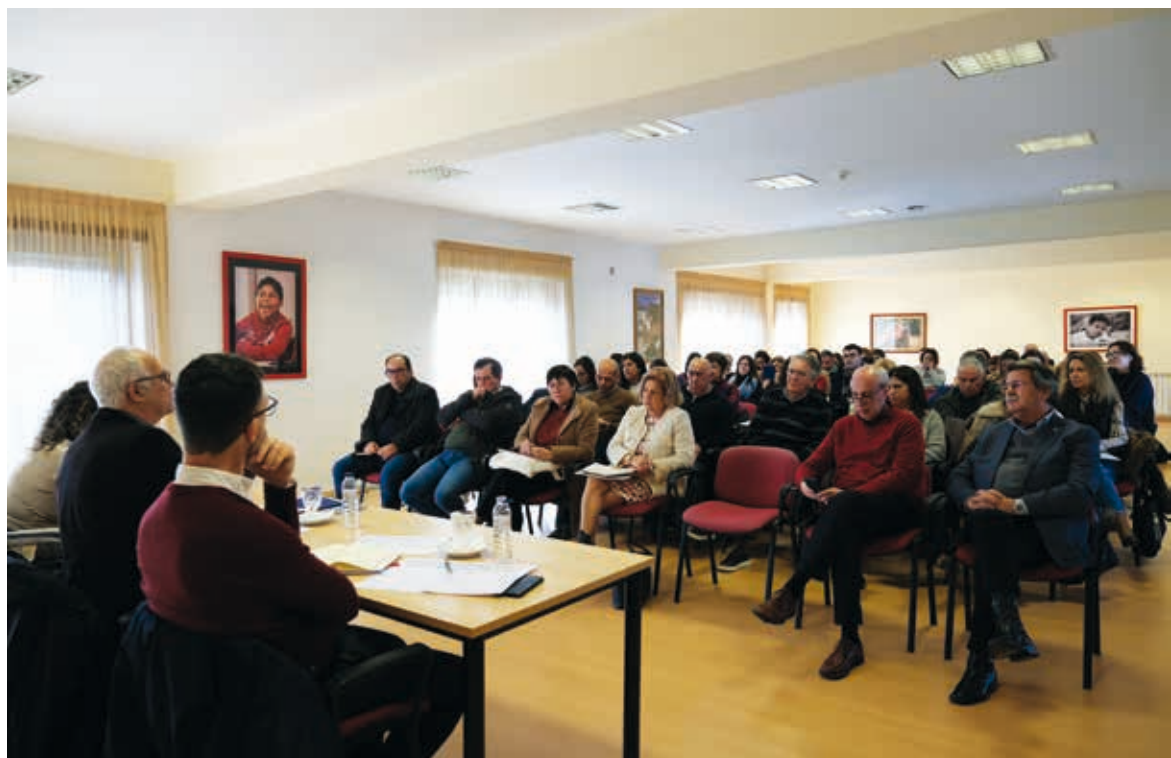
A reunião entre UMP e 24 Misericórdias teve lugar no Centro João Paulo II, em Fátima

Recorde-se que o 'Cuidar em Demência' é um projeto de apoio domiciliário e social para pessoas com demência, visando estimular, autonomizar e apoiar os doentes e as suas famílias, com o objetivo de melhorar a qualidade de vida.