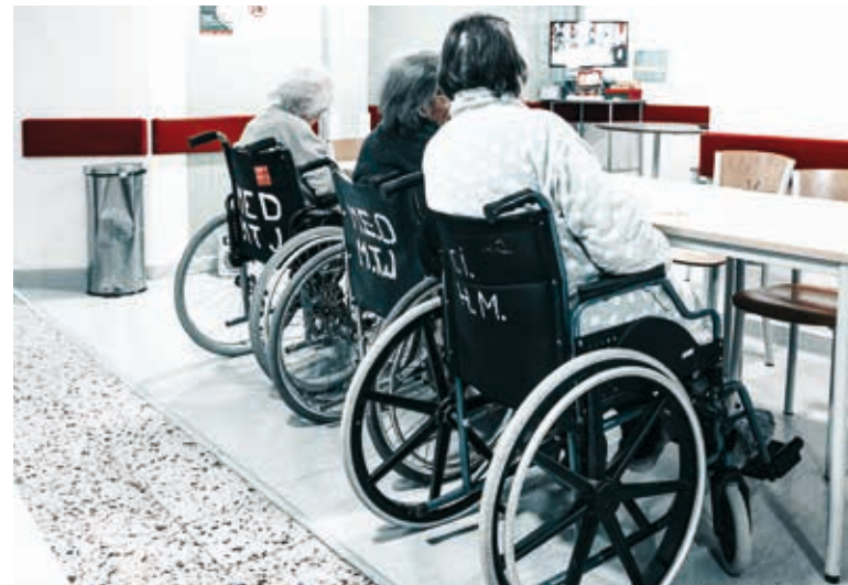
Nova unidade está a receber pessoas com alta hospitalar desde o início do ano

Unidade de Cuidados de Transição da Misericórdia do Montijo tem 35 camas protocoladas com a ULS e está a funcionar desde o início do ano