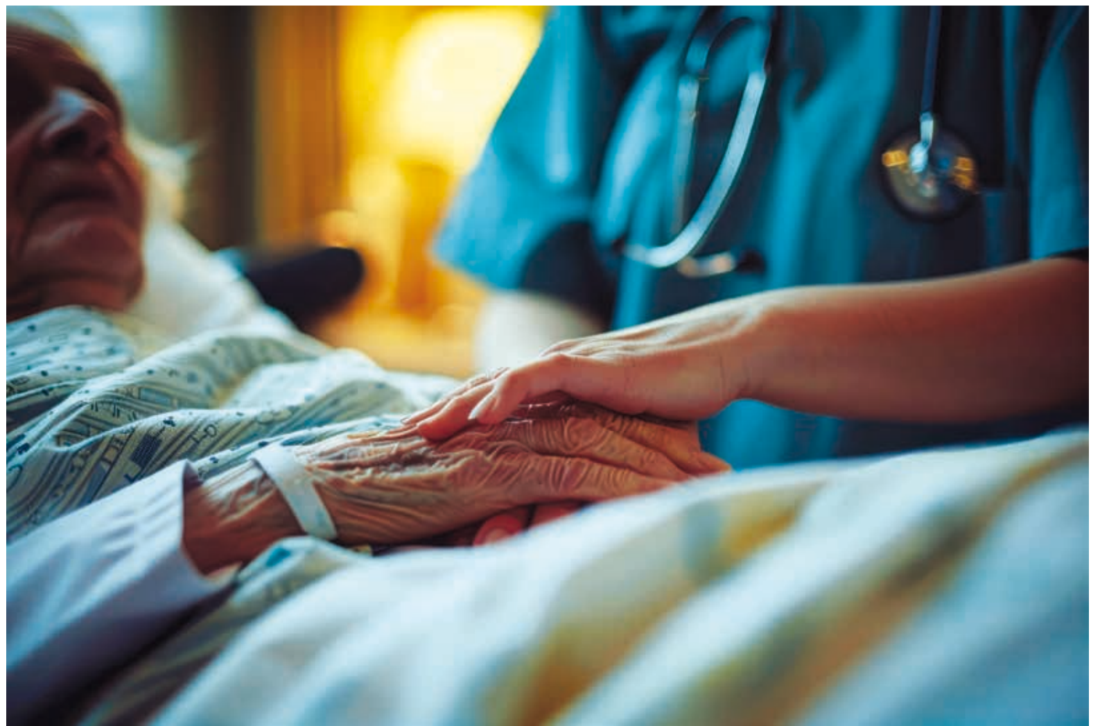
A portaria 20/2026/1, de 20 de janeiro, cria unidades intermédias para acolher utentes que se encontrem em internamentos sociais nos hospitais do SNS

O Dia Internacional do Riso, celebrado a 18 de janeiro, foi vivido de forma muito especial na Misericórdia de Mangualde. A 'Unidade Sorriso', composta por trabalhadores de diversas áreas (enfermeiros, técnicos de serviço social, psicólogos, animadores etc.), espalhou alegria pelos utentes de todas as valências. O projeto foi lançado em 2017 com o objetivo de animar os idosos.