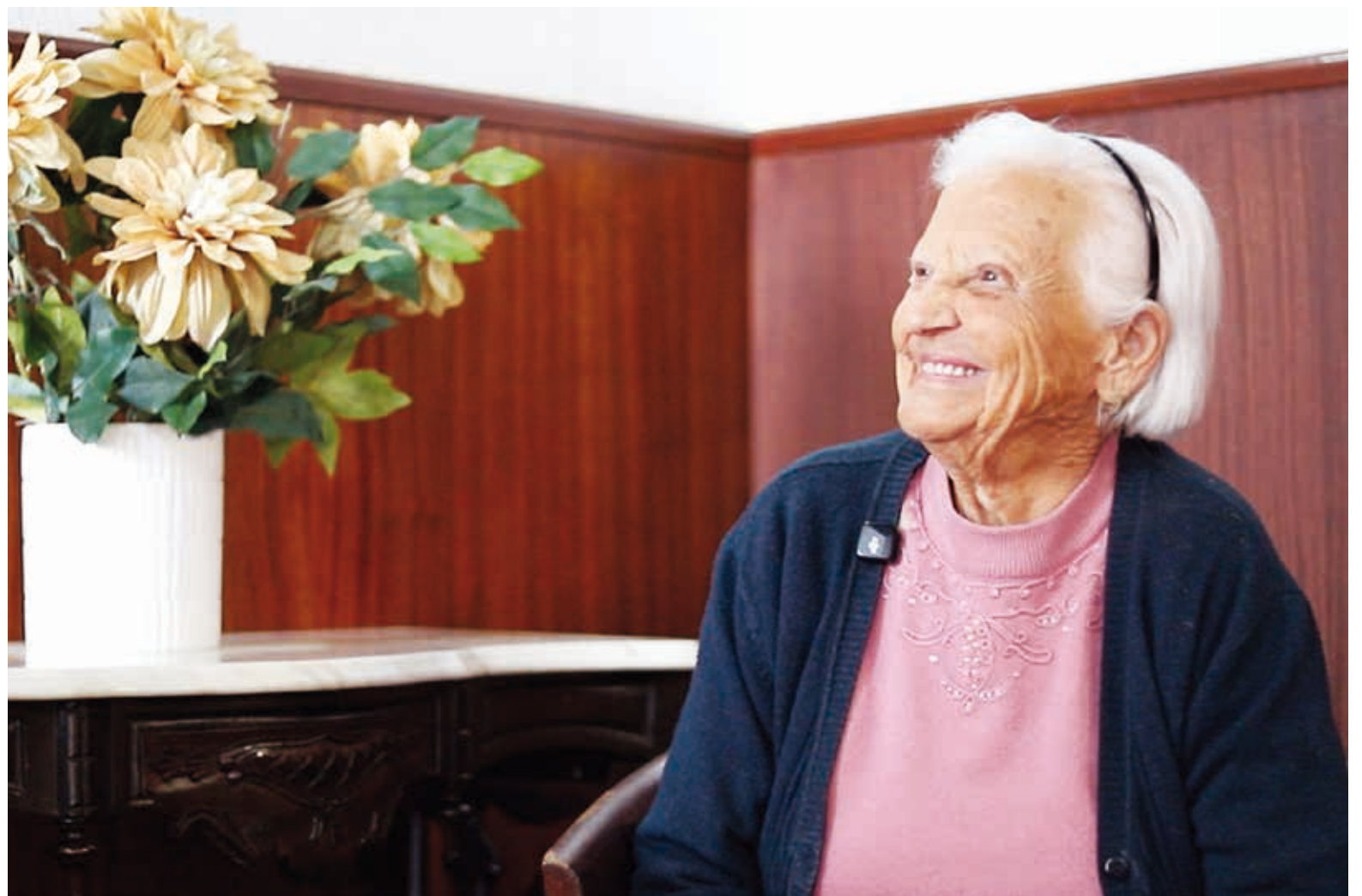
Podcast visa ser ‘espaço seguro e humanizado, no qual cada utente é reconhecido como sujeito de história e não apenas como destinatário de cuidados’

A Circular 19/2026 pode ser consultada em ump.pt ou na plataforma Rede UMP.