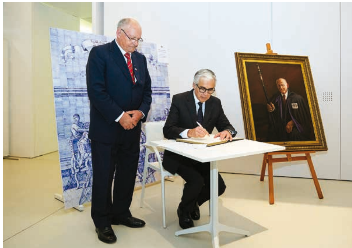
O presidente da Assembleia da República, José Pedro Aguiar Branco, visitou a Santa Casa de Grândola

Vila Velha de Ródão (na foto) foi uma das Misericórdias que, em fevereiro, recebeu a visita de voluntários da Missão País. De norte a sul, os jovens dinamizaram inúmeras iniciativas nas Santas Casas de Álvaro, Arouca, Belmonte, Bombarral, Boticas, Cantanhede, Carregal do Sal, Chaves, Fornos de Algodres, Monção, Sesimbra, Vale de Besteiros e Vale de Cambra etc.