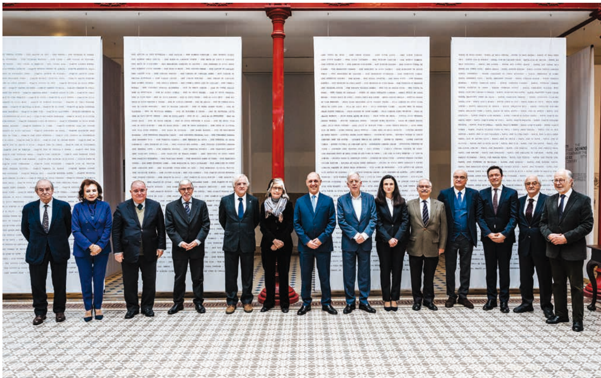
MISERICÓRDIA DO PORTO

O novo grupo de trabalho da Misericórdia do Porto é coordenado por Manuel Pizarro, ex-ministro da Saúde