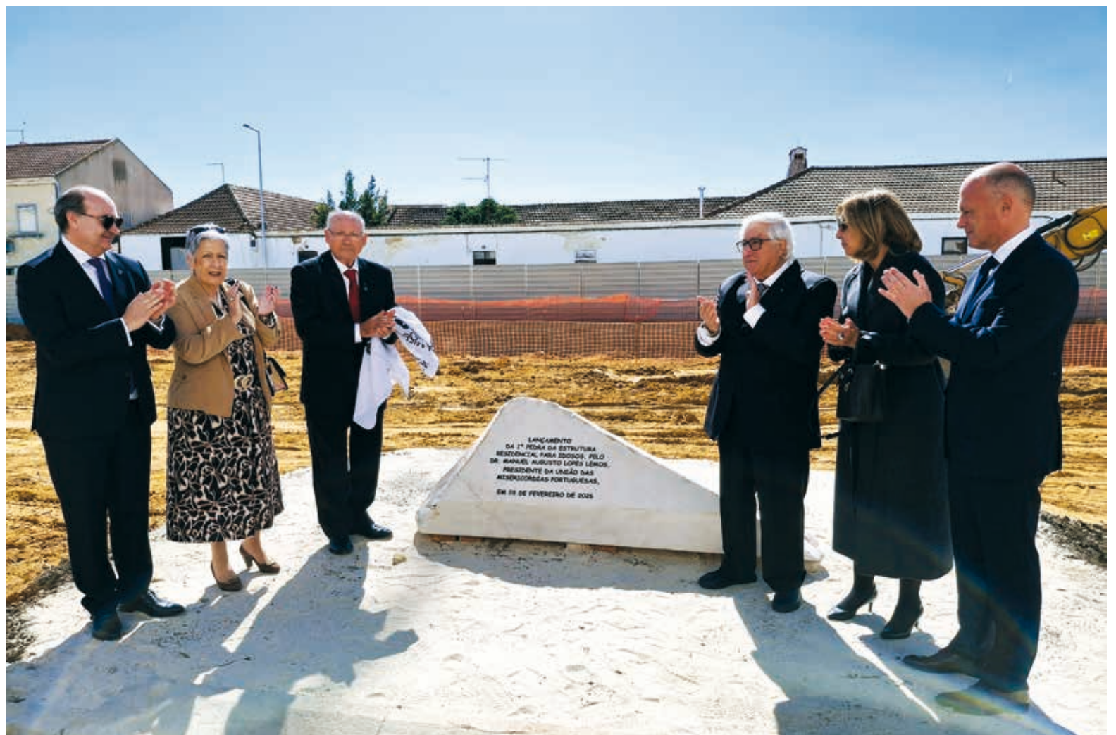
Para além das 80 camas, o novo edifício irá integrar diversos serviços de apoio, incluindo áreas médicas e de fisioterapia

Para mais informação, consultar site da UMP.