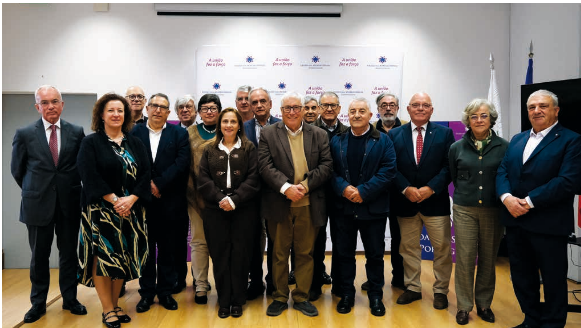
No dia 18 de março, cerca de 15 novos dirigentes foram convidados a conhecer a 'casa de todas as Misericórdias'

Novos provedores foram recebidos na sede da UMP em Lisboa, numa sessão para partilha, convívio e apresentação dos principais serviços prestados às Misericórdias