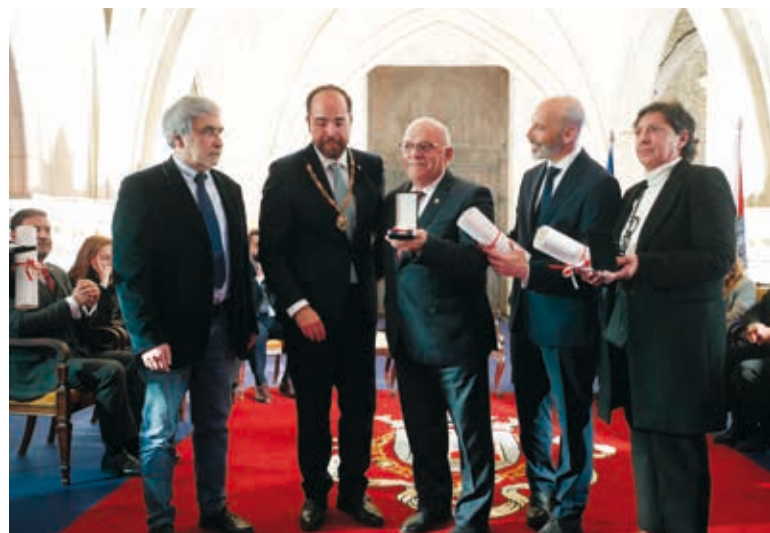
A homenagem teve lugar no âmbito do Dia da Cidade, assinalado a 19 de março

A homenagem reconheceu o contributo histórico e continuado destas instituições no apoio social às populações