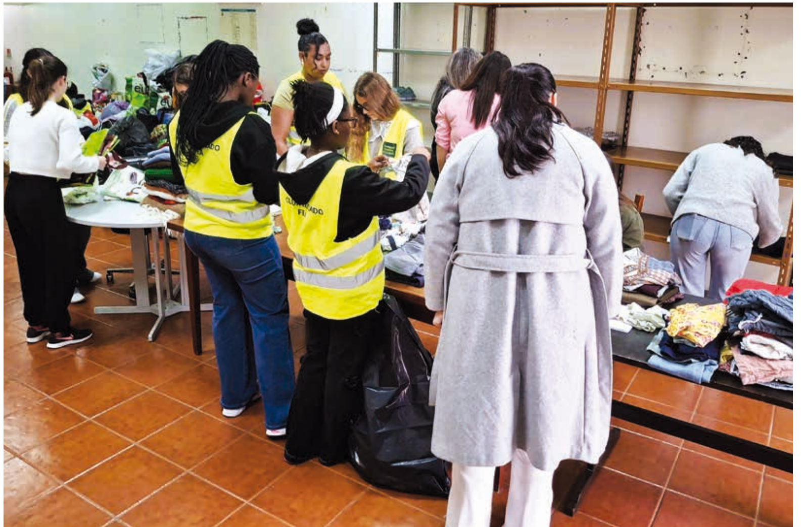
Em 2025, a loja social apoiou pessoas de 21 nacionalidades diferentes, num total de cerca de 36 mil doações anuais

A Santa Casa da Misericórdia da Lousã participou na matiné dançante da primavera, promovida pelo município da Lousã no âmbito do plano municipal sénior. O evento assinalou a chegada da primavera com muita música e um momento de zumba sénior, ao qual aderiram os utentes dos lares da Santa Casa, assim como dos centros de dia da Lousã e de Foz de Arouce, ambos da instituição.