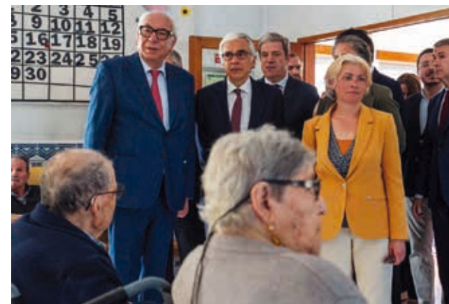
Presidente da Assembleia da República liderou a comitiva parlamentar que, a 20 de abril, visitou a Misericórdia de Pombal

Comitiva liderada pelo presidente da Assembleia da República, José Aguiar-Branco, visitou a Misericórdia de Pombal