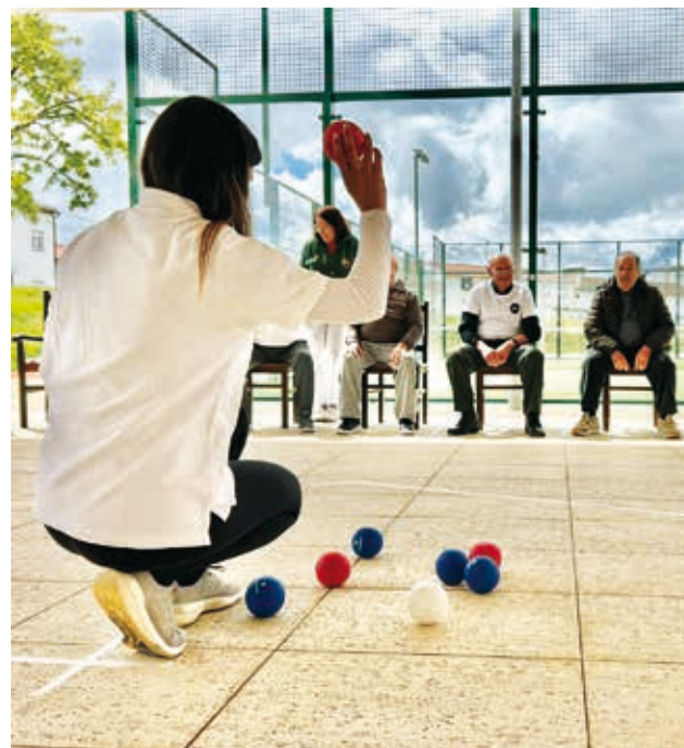
I Encontro de Boccia Sénior reuniu cerca de meia centena de participantes de várias instituições do concelho de Nisa

Mais do que um evento pontual, o I Encontro de Boccia Sénior surge como um exemplo de boas práticas na intervenção com a população idosa, evidenciando como atividades simples, mas estruturadas, podem ter um impacto significativo na qualidade de vida. A Santa Casa da Misericórdia de Alpalhão pretende, por isso, dar continuidade a iniciativas deste género, consolidando uma resposta centrada no envelhecimento ativo, na participação e na dignidade da pessoa idosa. A Misericórdia de Alpalhão apoia quase 120 pessoas por dia.