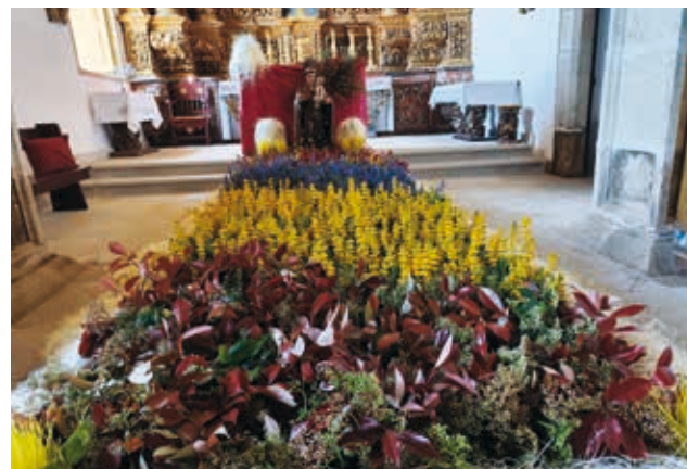
As flores mantêm-se nos templos até domingo de Páscoa e é dos raros momentos em que a capela da Misericórdia abre ao público

‘Antigamente não era a Misericórdia, eram as pessoas que as semeavam e as traziam para a igreja’, contou o provedor