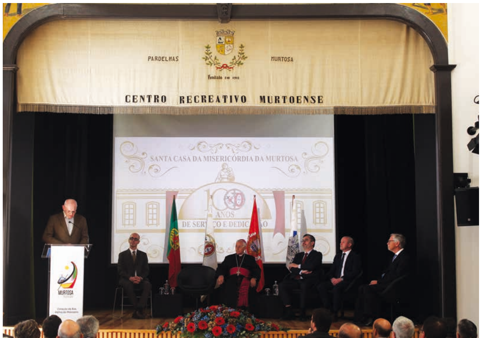
Centenário foi assinalado com sessão solene onde passado e futuro se cruzaram

Nos dias 17, 18 e 19 de abril, decorreu na capela da Misericórdia de Coimbra o V Concurso Nacional de Órgão, onde quase vinte jovens intérpretes tocaram no órgão de tubos da Santa Casa, divididos em três categorias. Em nota divulgada nas redes sociais, a Misericórdia expressou a sua alegria pelo instrumento clássico estar "ao serviço dos mais novos".