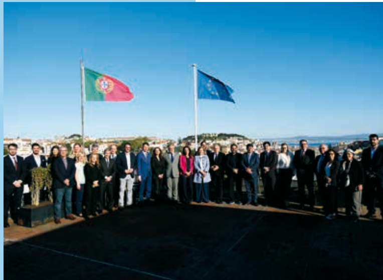
Debate com Comissão do Parlamento Europeu para Habitação foi a 30 de março

A UMP marcou presença numa mesa redonda sobre o panorama da habitação em Portugal com membros da Comissão do Parlamento Europeu para a Habitação