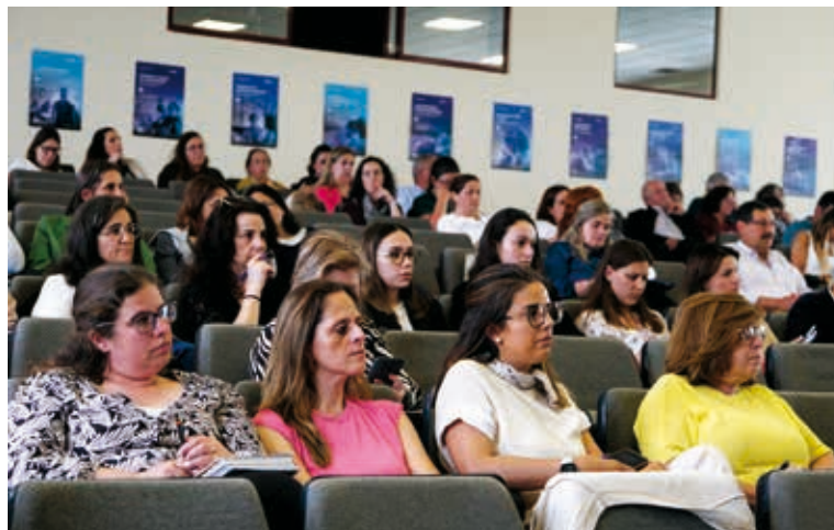
Ao longo das três sessões, em Fátima, Portel e Vila Verde, marcaram presença perto de 500 pessoas, entre técnicos e dirigentes

Entre as novidades de 2026, o vice-presidente com o pelouro de ação social destacou a alteração do limite anual por equipamento, introduzida em 2025, justificando que, não sendo norma alterar princípios nas adendas, neste caso, “a UMP exigiu esta alteração porque colocava em causa a nossa missão e vocação para apoiar os mais carenciados”.